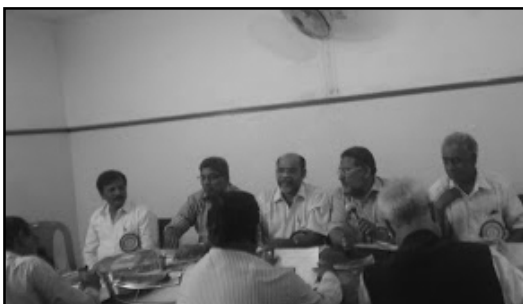
Discussion going on between members during CWC Meeting held at Salem (TN Circle)